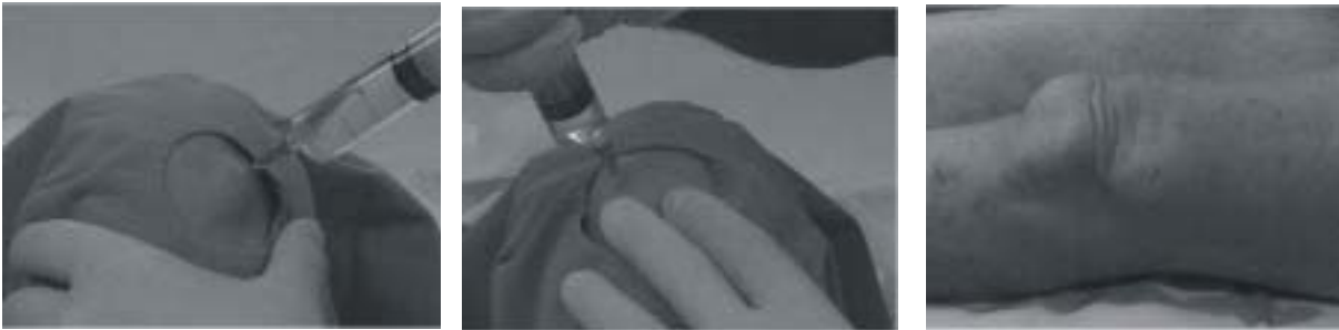
Fig. 2: Infiltración de ambos portales anteriores (lateral y medial) y aspecto de la rodilla luego de finalizada la infiltración de los tres portales.

obesos es difícil obtener una adecuada relajación muscular, lo que, sumado a la pérdida de referencias anatómicas, dificulta el procedimiento anestésico, el desarrollo de toda la cirugía y el posicionamiento del miembro inferior. Asimismo, está contraindicada en pacientes ansiosos, aprehensivos o que se nieguen al procedimiento; en menores de 18 años o pacientes menores de 40 kg; en procedimientos artroscópicos bilaterales, en aquellos individuos que presenten un espacio intraarticular estrecho, reacciones de sensibilidad o alergia a los anestésicos locales de tipo amida e infección en el sitio de punción. No la deberían practicar profesionales en etapa de aprendizaje o que no estén familiarizados con la técnica (maniobras bruscas de Varo o Valgo).